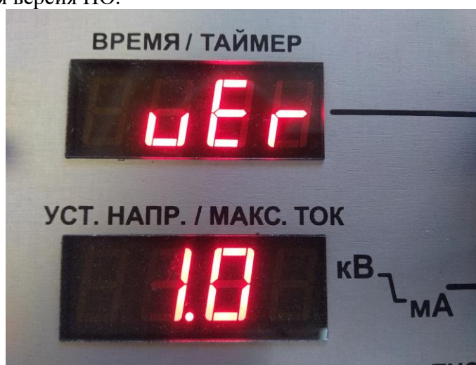
Рисунок 1. Отображение версии ПО при запуске аппарата.

Для обеих модификаций проводится аналогично: при включении аппарата на правом верхнем сегментном индикаторе отображается надпись "ver", на правом нижнем сегментном индикаторе отображается версия ПО.