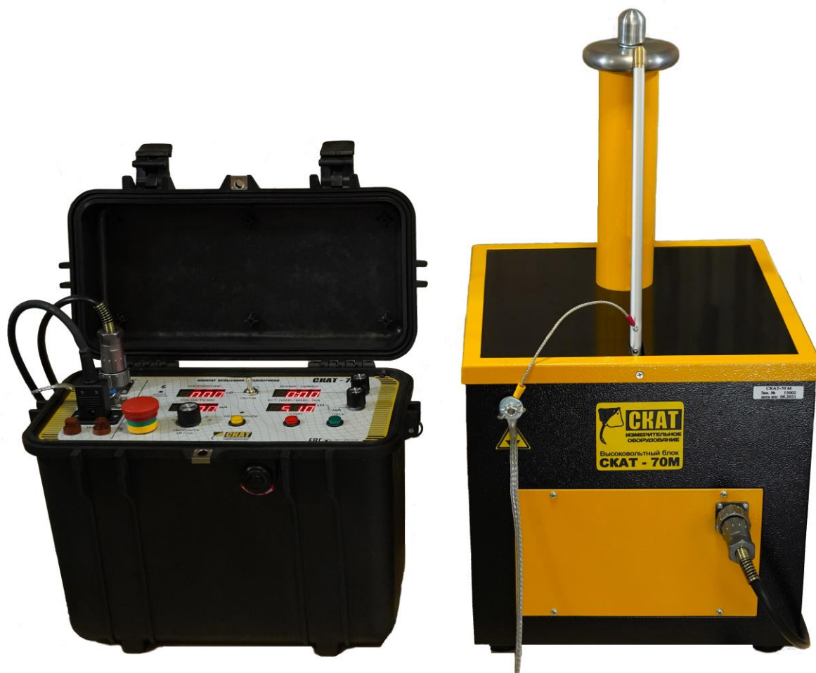
Рис. 1. Внешний вид аппарата СКАТ-70М.

Аппарат СКАТ-70М представляет собой переносной прибор, состоящий из двух блоков, высоковольтного и управления, которые соединены между собой кабелем. Внешний вид аппарата приведён на рис. 1.