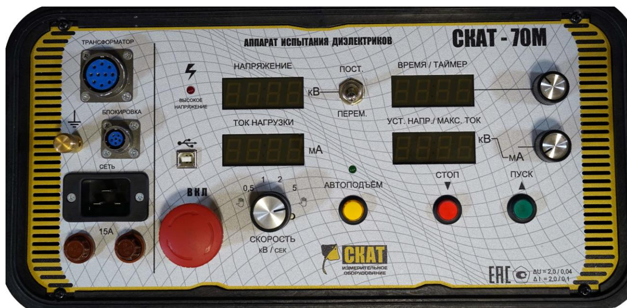
Рис. 2. Внешний вид передней панели блока управления.

Внешний вид передней панели блока управления приведён на рис. 2.