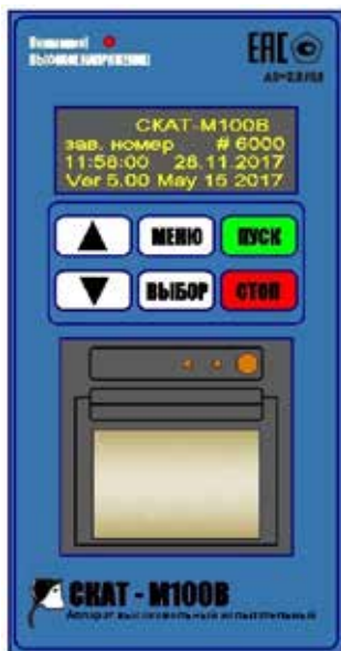
Рис.2 Передняя панель управления

3.5. Органы управления и средства индикации расположены на передней панели аппарата, которая находится справа от дверцы. Внешний вид передней панели изображён на рис. 2.