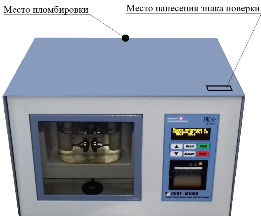
Рисунок 1 - Общий вид аппаратов высоковольтных испытательных СКАТ-М100В

Общий вид аппаратов высоковольтных испытательных СКАТ-М100В с указанием места пломбировки и места нанесения знака поверки представлен на рисунке 1.